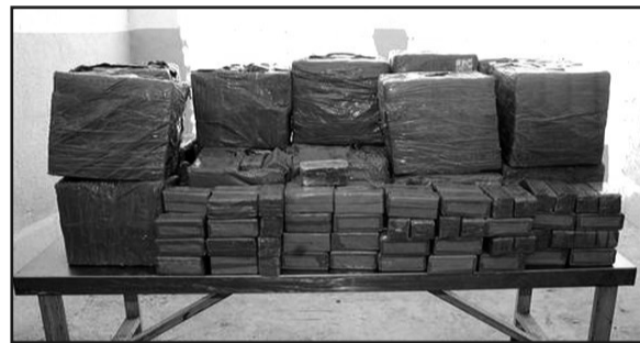
ligné la communiqué.

Les services de sécurité de Khenchela ont déjoué, la semaine écoulée, un projet criminel visant à faire passer près de 02 quintaux et 42 kg de kif traité en provenance du Maroc, a indiqué ce lundi la sûreté de la même wilaya dans un communiqué. L'opération a été réalisée en deux étapes, a souligné la même source. La première a été opérée dans la wilaya de Khenchela et a permis de saisir 01 quintal et 31 kg de cette drogue trouvée dans un véhicule utilitaire et d'arrêter deux (02) personnes déjà connues des services judiciaires. Après des enquêtes de terrain minutieuses, les enquêteurs ont pu identifier et arrêter le troisième suspect dans la ville de Constantine, en saisissant sur lui 111 kg de kif traité soigneusement cachés dans le second véhicule utilitaire. Les 3 suspects ont été présentés devant le procureur de la République près le tribunal de Khenchela, sou-