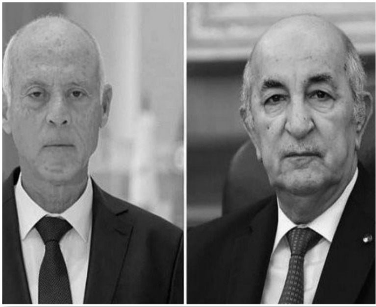
Le président de la République, M. Abdelmadjid Tebboune a reçu, mercredi,

un appel téléphonique du président de la République tunisienne, M. Kaïs Saïed, qui lui a exprimé "ses vifs remerciements" et fait part de sa "haute considération" pour la "célérité avec laquelle l'Algérie a réagi en dépêchant des renforts" à son pays pour aider à circonscrire les feux de forêt, indique un communiqué de la Présidence de la République. "Le président de la République, M. Abdelmadjid Tebboune a reçu, ce jour, un appel téléphonique de son frère M. Kaïs Saïed, président de la République tunisienne, qui lui a exprimé ses vifs remerciements et fait part de sa haute considération pour la célérité avec laquelle l'Algérie a réagi en dépêchant des renforts à la Tunisie, pays frère, pour aider à circonscrire les feux de forêt, se félicitant de l'esprit de fraternité et de solidarité constante entre les deux peuples frères", précise le communiqué.