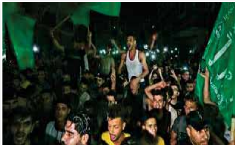
CONFLIT A GAZA: